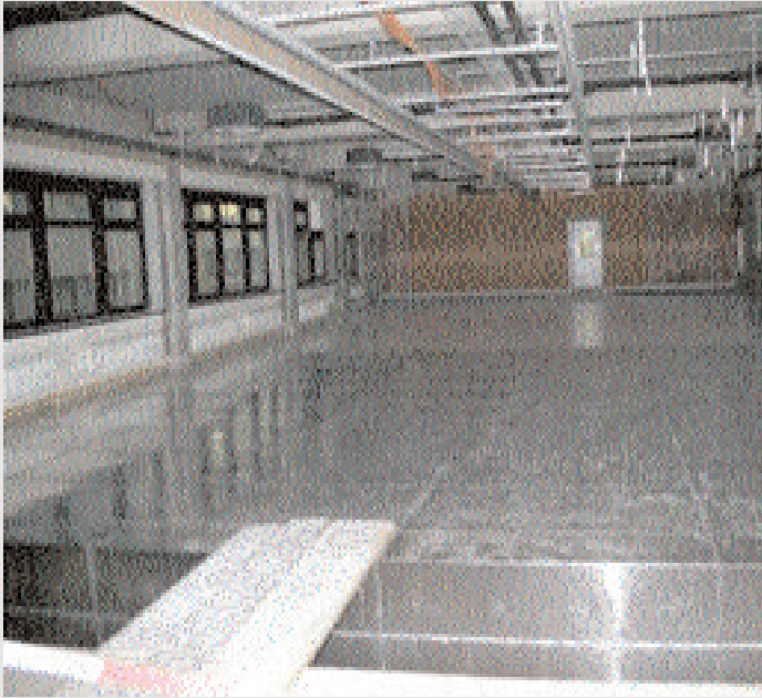
Die grossflächige Abschirmung eines Bürogebäudes gegen eine darunterliegende Trafostation mit Aaronia Magnoshield®.

Um einen Raum z.B. gegen das niederfrequente Magnetfeld einer Transformator-Station abzuschirmen, muss die Fläche zur Magnetfeldquelle lückenlos mit Aaronia MagnoShield® Abschirmplatten ausgekleidet werden. Nur so ist die Durchdringung der Magnetfelder optimal abgewehrt (ACHTUNG: Soll hingegen zusätzlich noch eine hochfrequente Strahlungsquelle wie z.B. Mobilfunk abgeschirmt werden, so muss der GESAMTE Raum lückenlos ZUSÄTZLICH noch mit dem Abschirmflies Aaronia X-Dream® ausgekleidet werden. Fenster müssen hierbei mit dem transparenten Abschirmstoff Aaonia-Shield® abgeschirmt werden.).